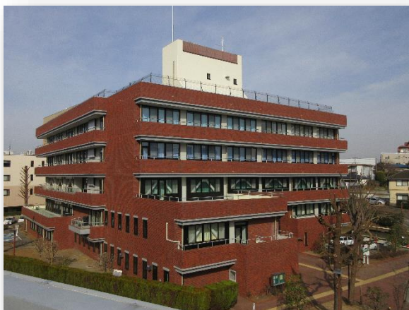
教育福祉会館外観