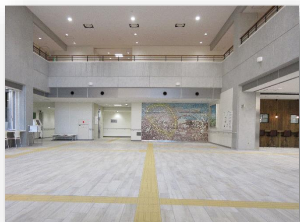
教育福祉会館3階ロビー